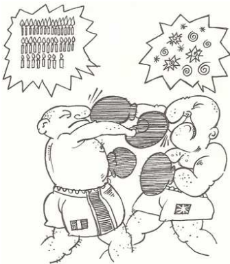
VOIR TRENTE-SIX CHANDELLES