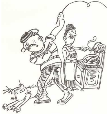
AVOIR D'AUTRES CHATS À FOUETTER